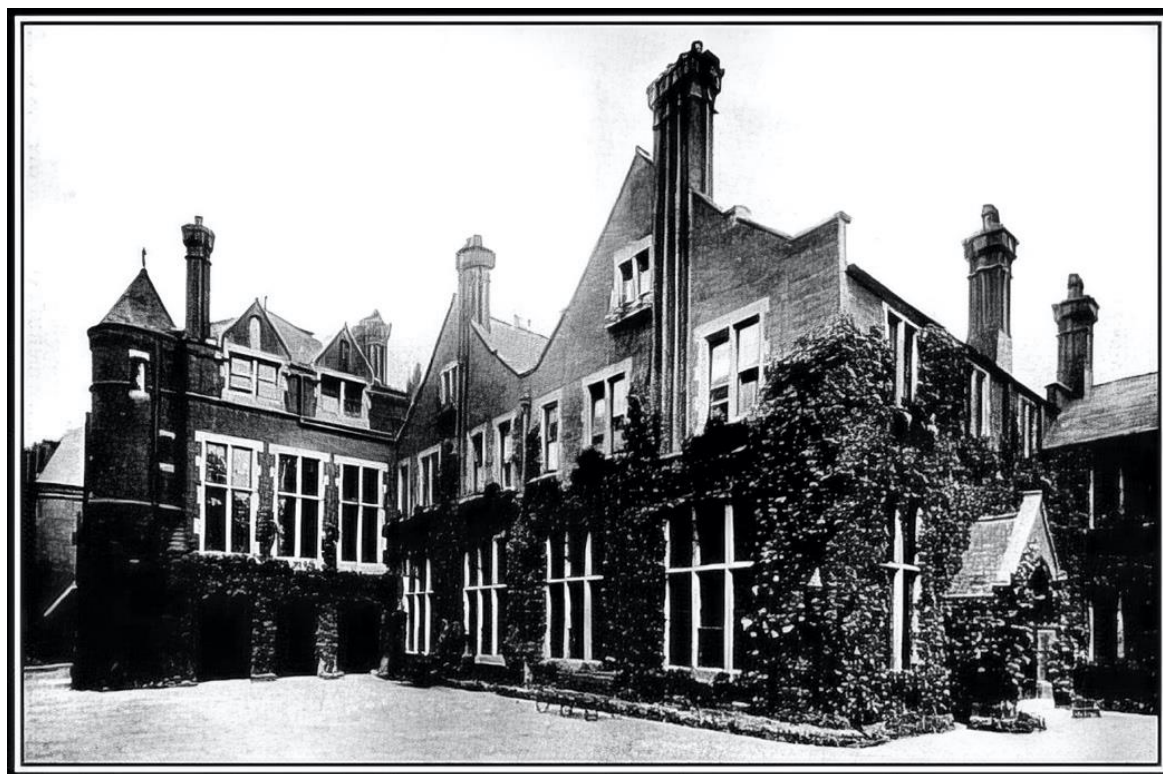
Figure 2. Toynbee Hall (1902)